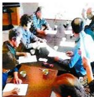
只今、知能機能テストに挑戦中！

コロナ禍で大変な時期ですが、『人生、下り坂サイコー！』と会員相互の親睦に努めています。