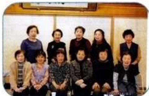
なでしこの会の皆さん

毎月1回、14名の会員はおしゃべりに夢中です。これが一番大切なことなのです。 一人暮らしの人には誰とも話をしないと、口が重くなるのです。時には温泉、食事、500円亭もみんなでやっています。