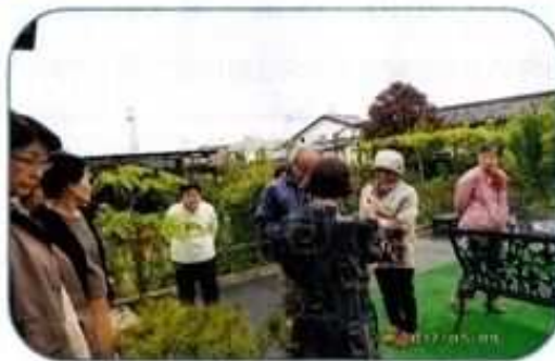
上町さくらの会の皆さん(山野草を鑑賞)