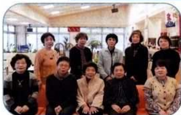
つくしの会の皆さん(やまぶき荘にて)